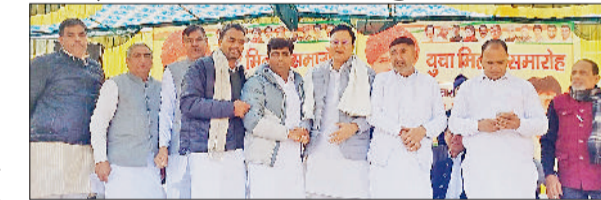
पूडरी। सांसद रणदीप सिंह सुरजेवाला का गांव जांबा में स्वागत करते ग्रामीण।