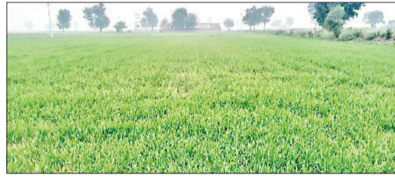
राजौद। शनिवार को लहराती हुई गेहूं की फसल का दृश्य।