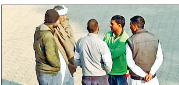
जींद। मृतका के शव का पोस्टमार्टम करवाने आए परिजन।