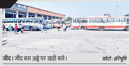
जीद। जीद बस अड्डे पर खड़ी बसें।