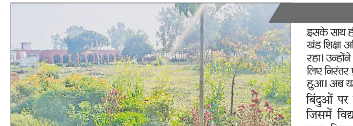
सीवन। सीवन के गांव मांझला के स्कूल का दृश्य।