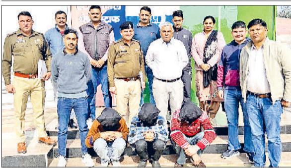
कैथल। एंटी डीकल थेट स्टाफ पुलिस गिरफ्त में लूट मामले के तीनों आरोपी

कालोनी की स्थिति, उसका वैध दर्जा, प्लॉटों की संख्या और अन्य बुनियादी जानकारीयें उपलब्ध कराई गई हैं ताकि लोगों को अपने मकान और कॉलोनी से जुड़ी स्थिति स्पष्ट रूप से पता चल सके।