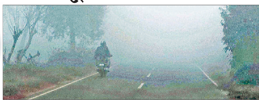
जीद। सुबह के समय धुंध के बीच गुजरता हुआ वाहन चालक।

पिछले दो दिनों से सुबह के समय कड़ाके की ठंड और फिर दोपहर बाद कुछ समय के लिए सूर्य देवता के दर्शन दिए जाने से राहत मिल रही है। दिन में अच्छी धूप खिलती है तो आस जागती है कि अगले दिन सुबह ही अच्छी धूप निकलेगी लेकिन हो इसके विपरीत रहा है। शाम होते-होते फिर शीत लहर चल पड़ रही है और तापमान में गिरावट आ रही है। शनिवार को भी सुबह कड़ाके की ठंड पड़ी और कुछ समय के लिए धुंध भी रही लेकिन तेज हवा चली और दस बजे के बाद सूर्य देवता बादलों की ओट से निकली। जिससे लोगों को ठंड से कुछ राहत मिली। शनिवार को अधिकतम तथा न्यूनतम तापमान में एक डिग्री का इजाफा हुआ। अधिकतम 13 डिग्री से बढ़ कर 14 डिग्री रहा तो न्यूनतम तापमान तीन डिग्री से बढ़ कर चार डिग्री दर्ज किया गया।