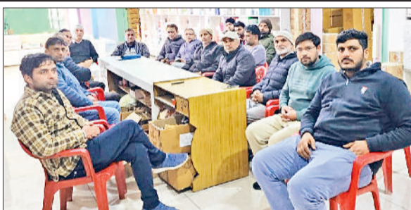
कलायत। केमिस्ट एसोसिएशन की आपात बैठक में उपस्थित पदाधिकारी व सदस्य।