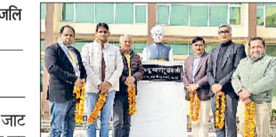
कैथल। जाट शिक्षण संस्थान के पदाधिकारी सर छोटू राम को याद करते हुए।