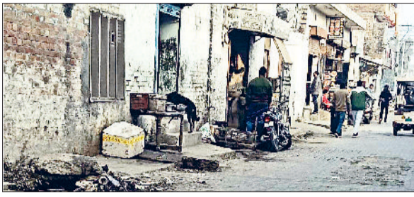
जींद। वह मार्केट, जिसे एनडीसी पोर्टल पर अवैध दिखा दिया गया है।

सरकार द्वारा एनडीसी पोर्टल पर दिए गए नए शहर की कई वैध कॉलोनिआं बने मकान और प्लॉट को अवैध दिखा दिया गया है। जिससे शहरवासियों में हड़कंप मच गया है। वहीं अधिकारियों का कहना है कि लोगों को इस बारे में घबराने की जरूरत नहीं है। जो कालोनियां वैध हैं, उनका गजट नोटिफिकेशन हुआ है, उनको कोई भी अवैध नहीं बता सकता है। जल्द ही सर्वे होगा, उसमें जो नूटियां होंगी। वह ठीक हो जाएंगी। बावजूद इसके लोगों में परेशानी बनी हुई है। पिछले सात